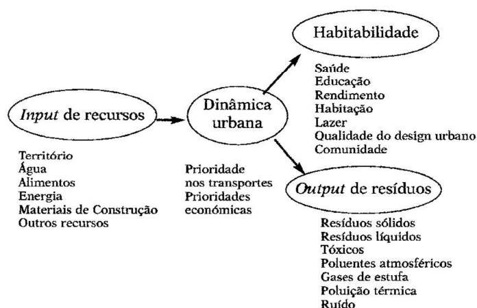
Fig. 1 – Modelo metabólico do espaço urbano.

É dentro desse ambiente urbano que engloba componentes naturais e construídos, podendo ser abordado segundo diversos pontos de vista. Sobre abordagem que integra os problemas urbanos ao aspecto físico/humano, é importante associar-se as interações dinâmicas entre as populações e as características físicas, bióticas, sociais, culturais do seu ambiente, como mostra a figura 1. Encarando o espaço urbano como um ecossistema, as condições atmosféricas integram-se no conjunto de fatores abióticos os quais, interagindo com outros fatores (bióticos) e socioculturais, condicionam a população humana.