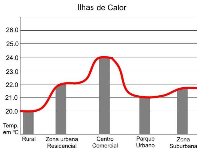
Fig. 2 – Relação da temperatura e áreas edificadas.

Segundo Pereira e Carvalho (2006), a figura 2 propõe algumas observações de um esquema ilustrativo do fenômeno “ilhas de calor” e como zonas urbanas e rurais apresentam diferentes temperaturas, com variação de até 4°C, de acordo com o grau de urbanização.