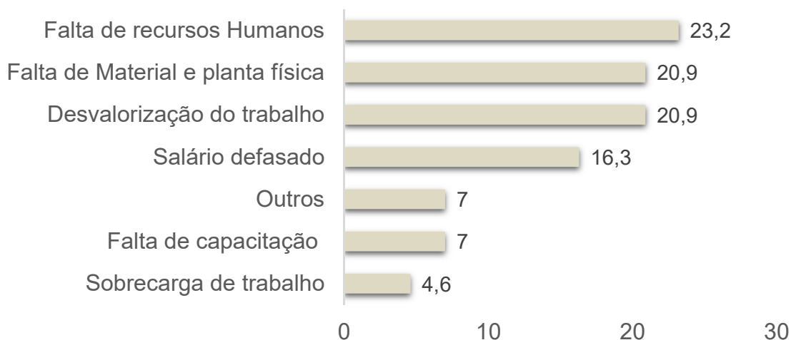
Figura 2 – Motivos da insatisfação dos profissionais das Equipes de Saúde da Família, em relação às condições de trabalho, que atuam em um município do Vale do Jequitinhonha/ MG, 2019.